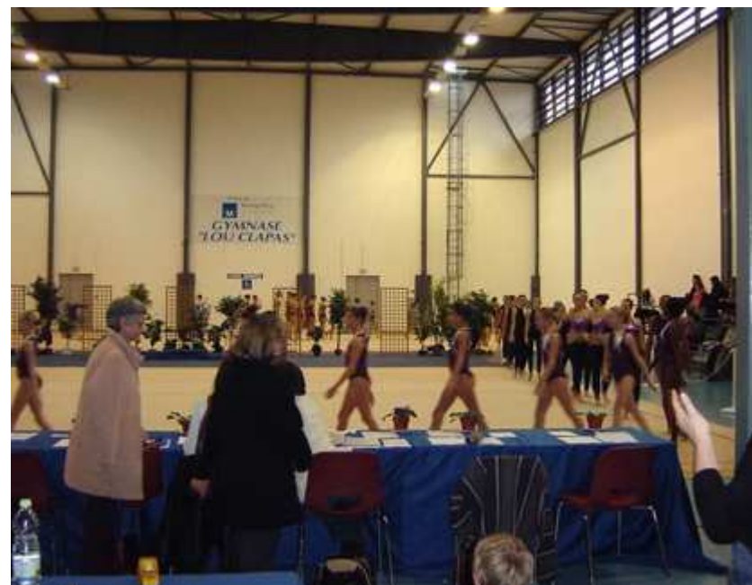
Gymnase « Lou Clapas » vue intérieure ci-dessus Vue extérieure ci-dessous

MONTPELLIER GRS 4 résidence Château d'Alco rue des avant-monts 34080 MONTPELLIER